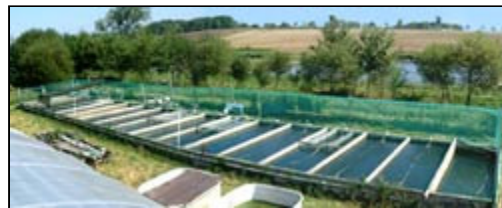
- Rapports d'analyses 2003 -